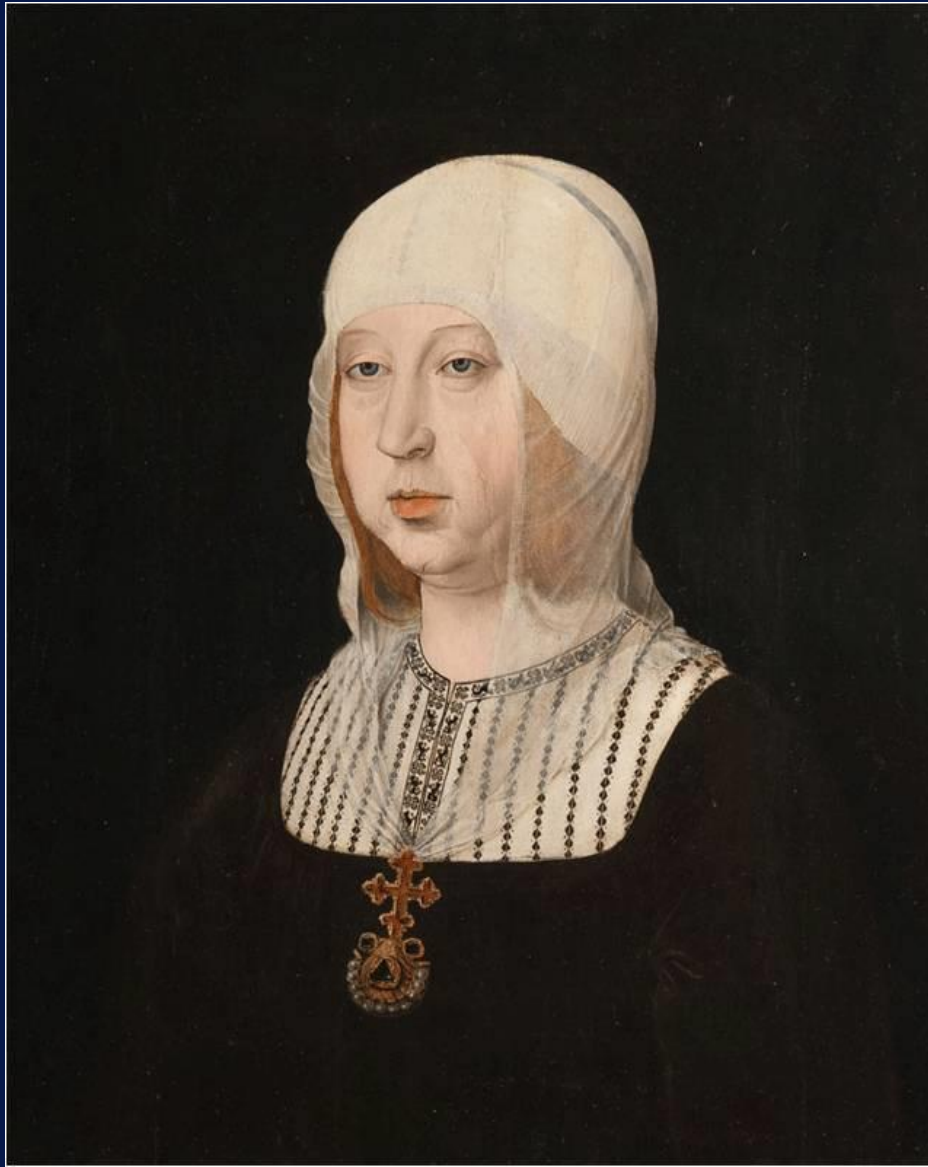
Isabella I. von Kastilien (1451-1504)