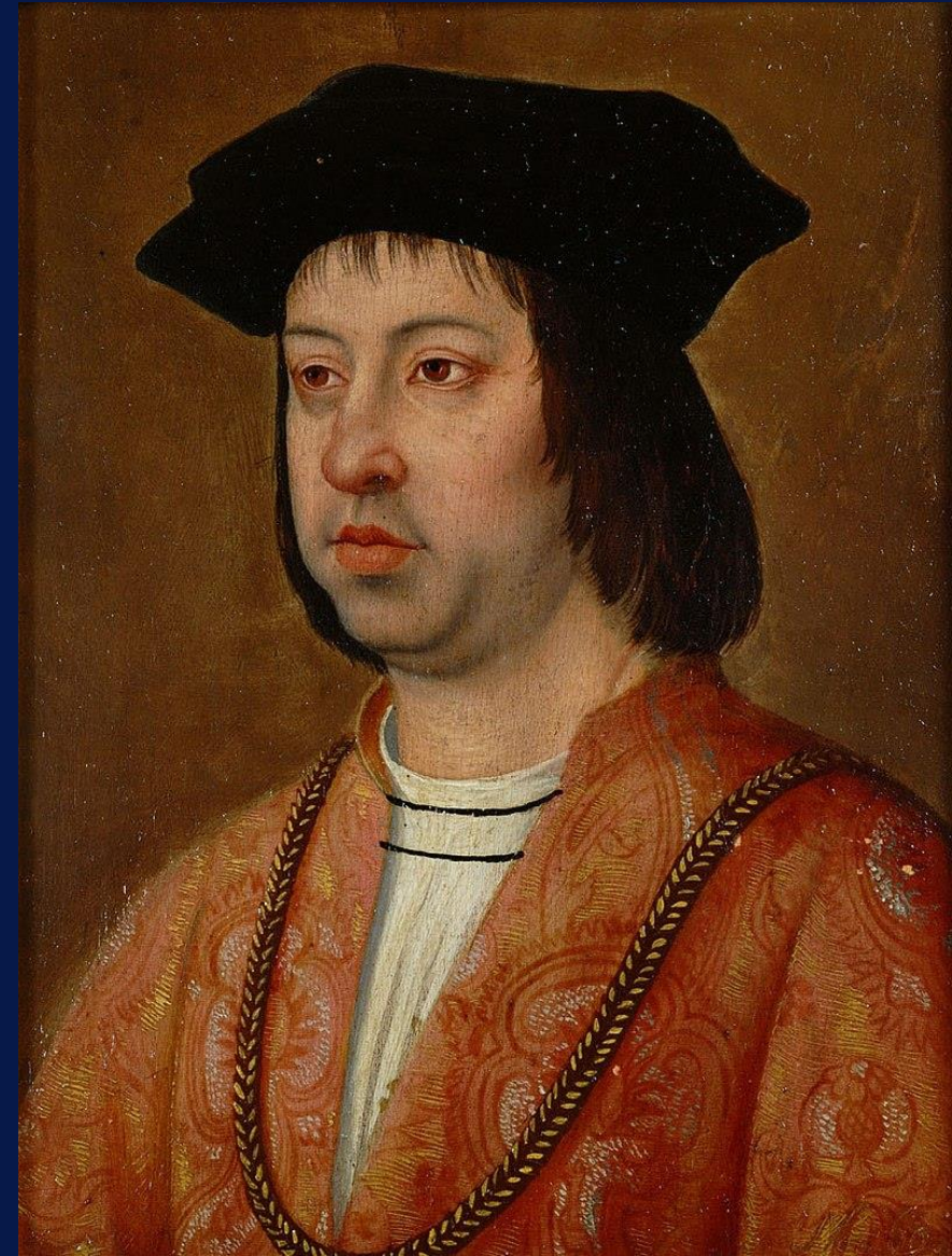
Ferdinand von Aragón (1452-1516)