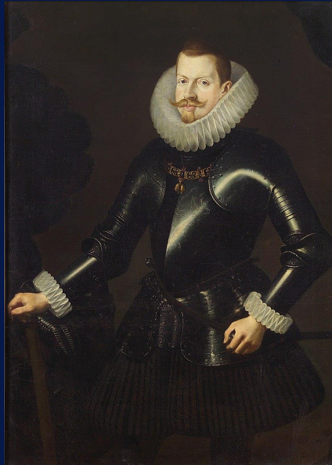
Philipp III. (1578-1621)