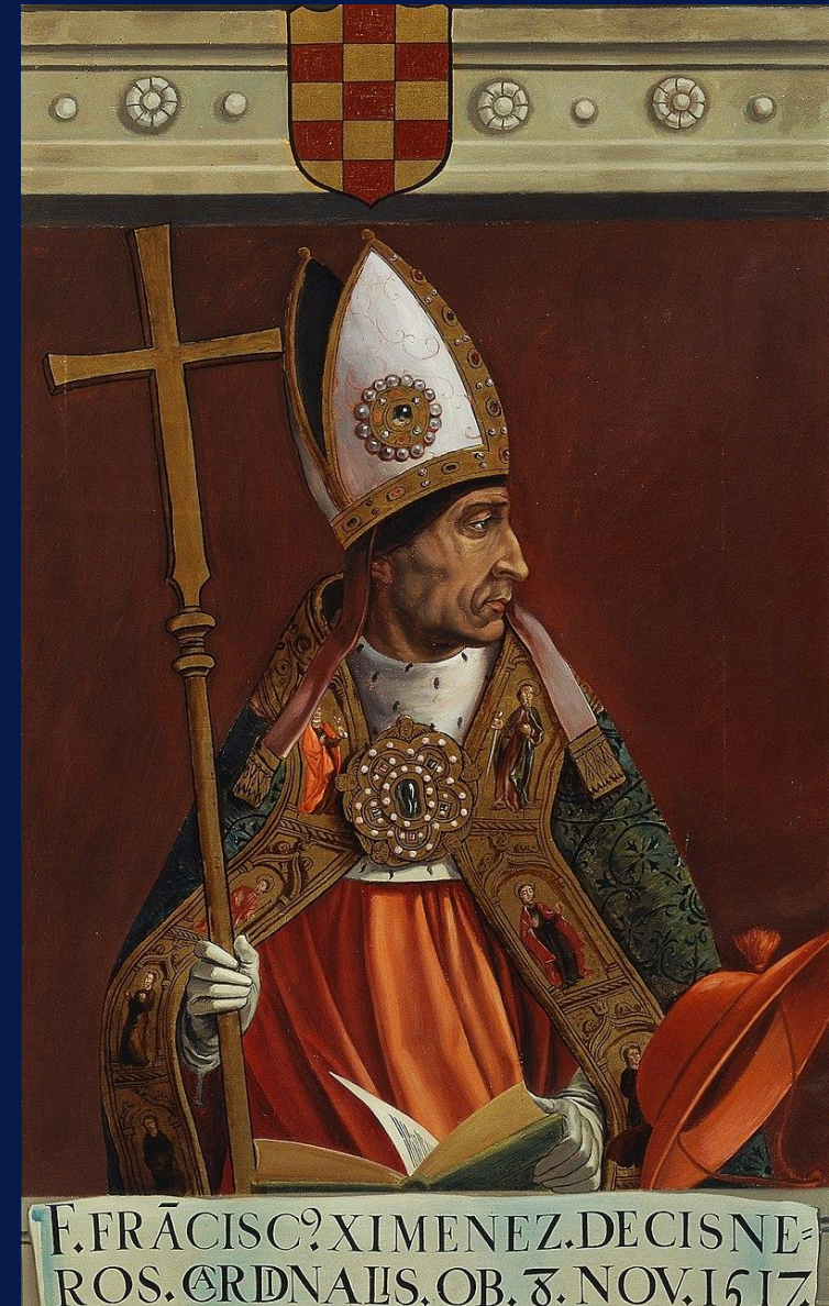
F. J. de Cisneros (1436-1517)