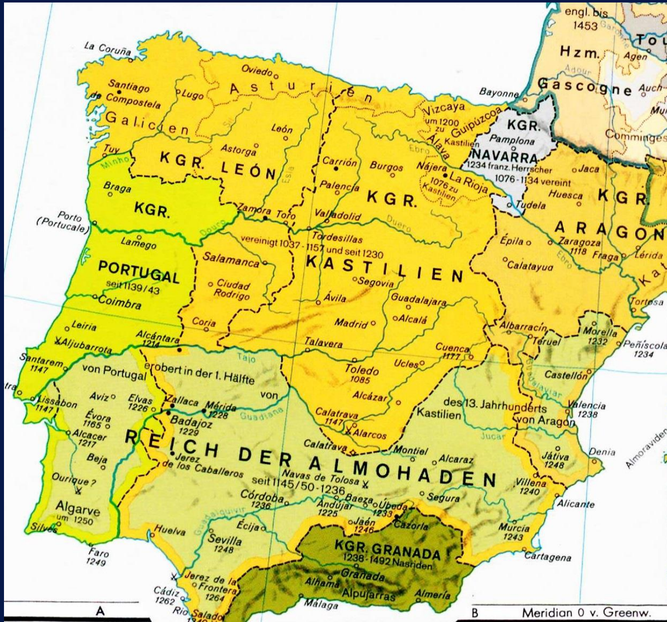
Abb. Walter Leisering (Hg.): Historischer Weltatlas. Berlin 2004, S. 46 (Ausschnitt).