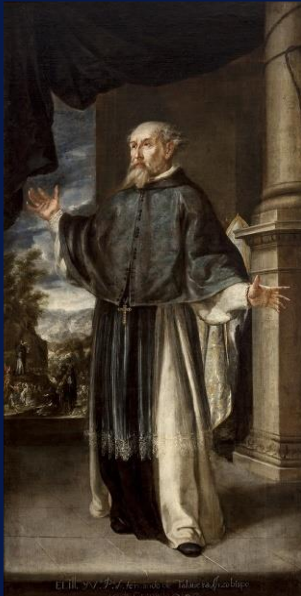
Hernando de Talavera (1428-1507)