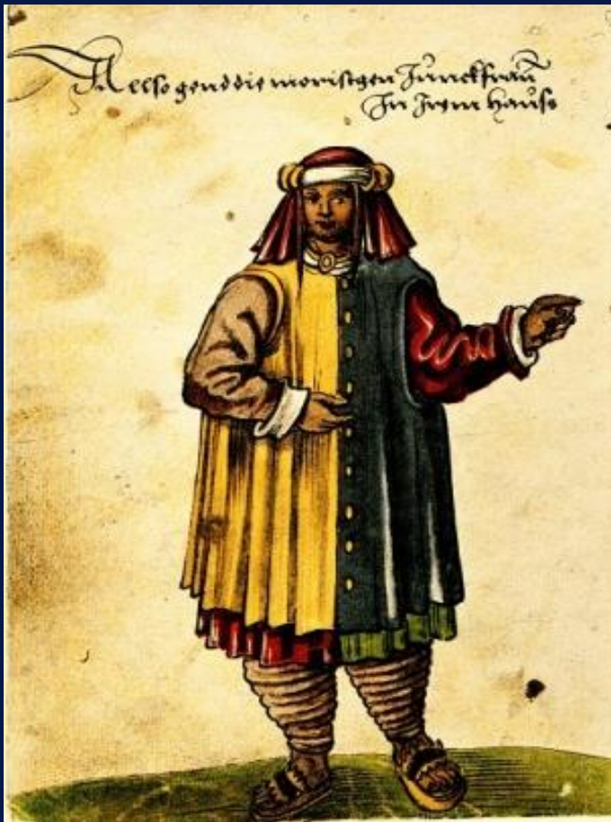
Haustracht (Tafel LXXXIII)